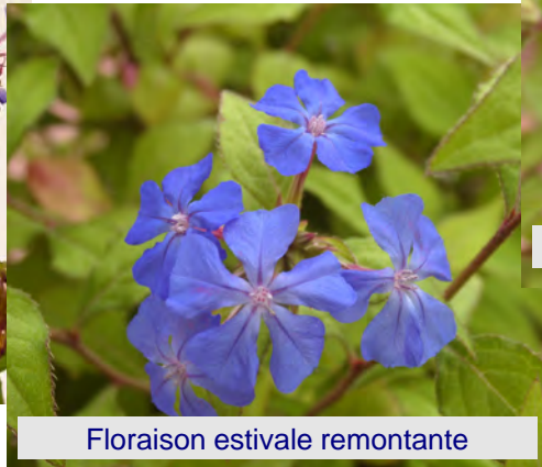
Floraison estivale remontante