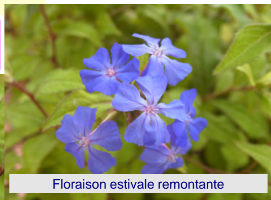
Floraison estivale remontante