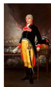
Félix de Azara

Du naturaliste espagnol Félix de AZARA qui le découvrit lors d'un voyage en Amérique du Sud à la fin 18ème siècle.